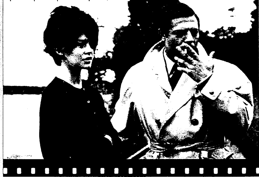
Брижит Бардо и Марчелло Мастоияни, 1961